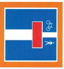
Situation générale (sans échelle) avec emplacement des panneaux de signalisation verticaux (4.09.1)