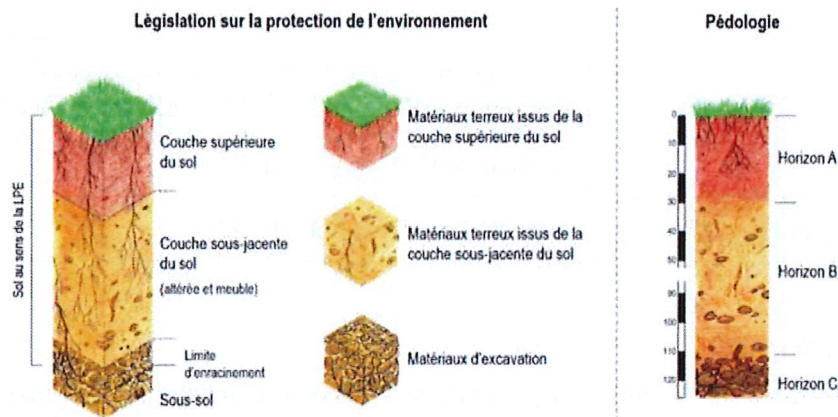
Figure 2 : Définitions du sol