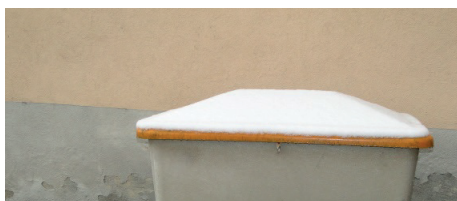
Place de la Grenade (salle Hermanjat)

Nous demandons à la population de faire preuve de compréhension et de prendre ses dispositions à l'avance afin d'éviter les désagréments habituels dus aux mauvaises conditions.